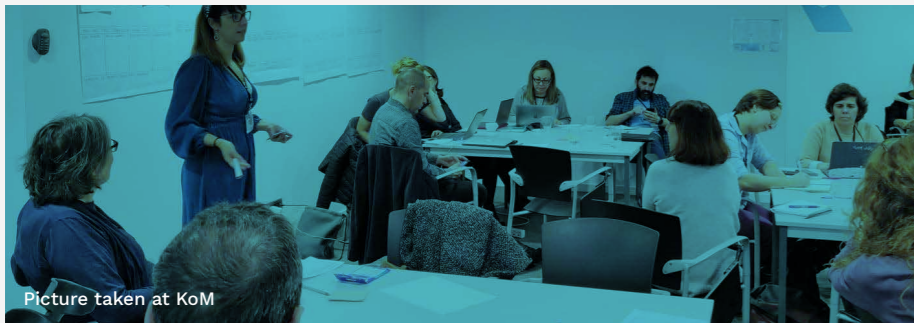
Picture taken at KoM

NEWSERA studia come migliorare le strategie di comunicazione dei progetti di citizen science, per raggiungere in modo più efficace pubblici diversi: i cittadini, gli scienziati, i decisori politici, le imprese (che sono considerati i quattro principali attori del sistema dell'innovazione, secondo il modello della quadrupla elica), ma anche i data journalist e i professionisti della comunicazione della scienza.